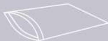
キャリングケース*1